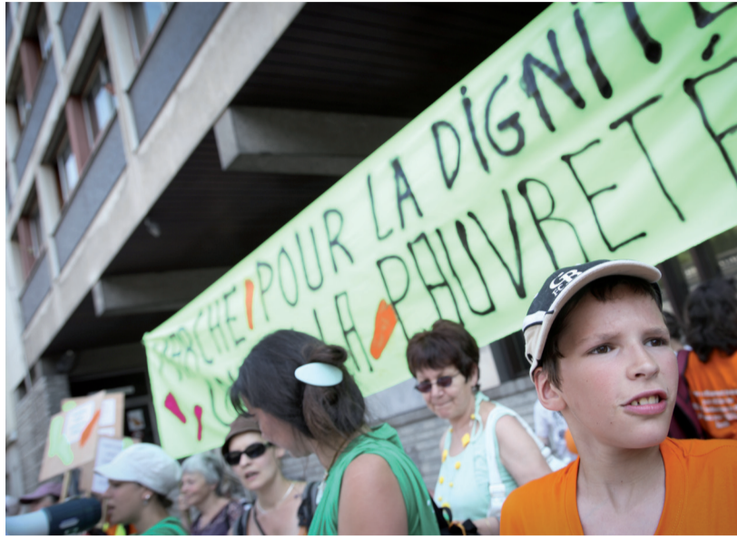
La marche pour la dignité s'est inspirée d'un mouvement citoyen en Inde.

C'est donc pour former une sorte de laboratoire de pensée qu'ils sont réunis : réfléchir à d'autres revendications, trouver de nouveaux modes d'organisation et d'action, et surtout plus de gens prêts à lutter à